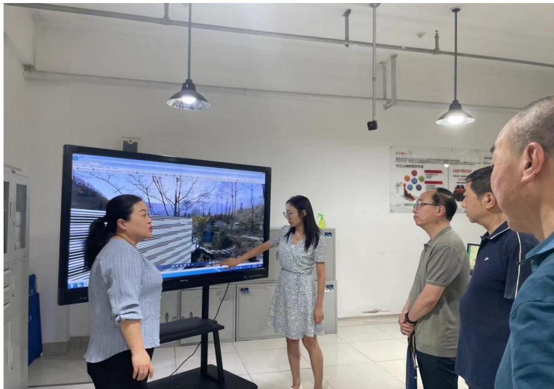
兰州文理学院成果共享与交流